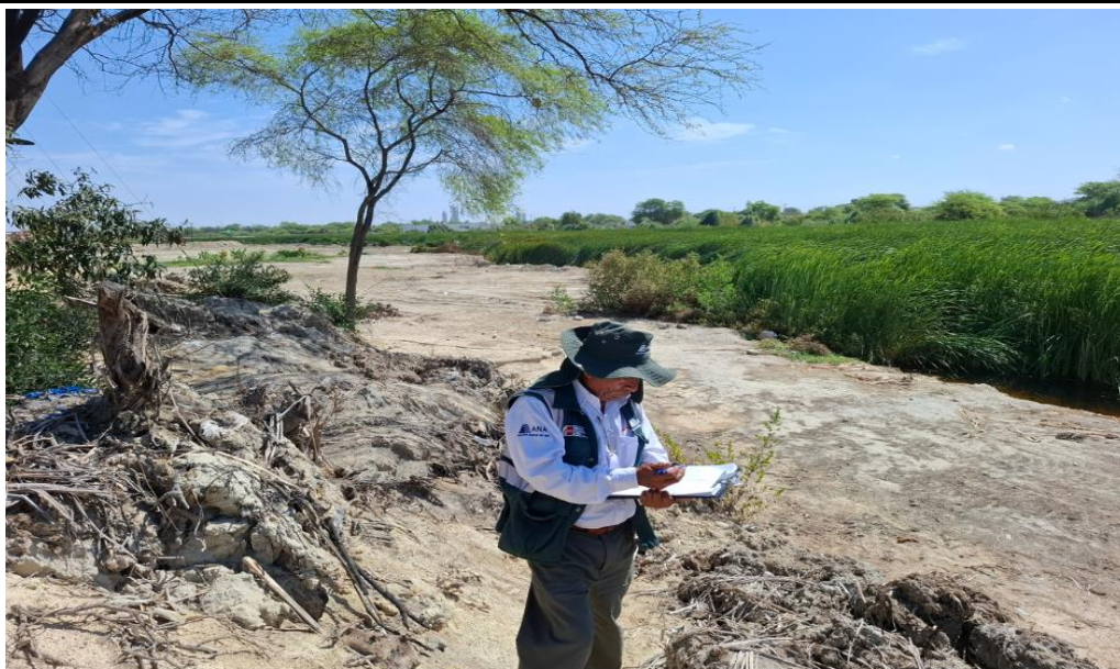
Figura N° 01: Se observa la colmatación de la quebrada El Pajarito