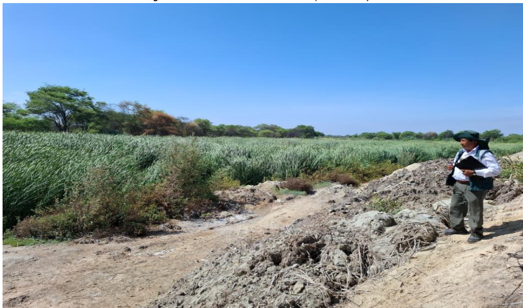
Figura N° 02: Se observa la colmatación en la margen derecha de la quebrada El Pajarito